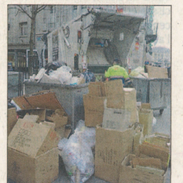
DÉCHETS Ce que ne veut plus

Les Jeunes Verts Neuchâtel (JVNE) ont franchi un pas politique en déposant, hier, leur toute première motion populaire. Muni de près de 300 signatures, ce texte intitulé «partenariat pour l'écologie» vise à faire «diminuer de manière importante les déchets engendrés par les commerces et les restaurants neuchâtelois». Pour parvenir à ce résultat, les JVNE souhaitent que le canton établisse un partenariat