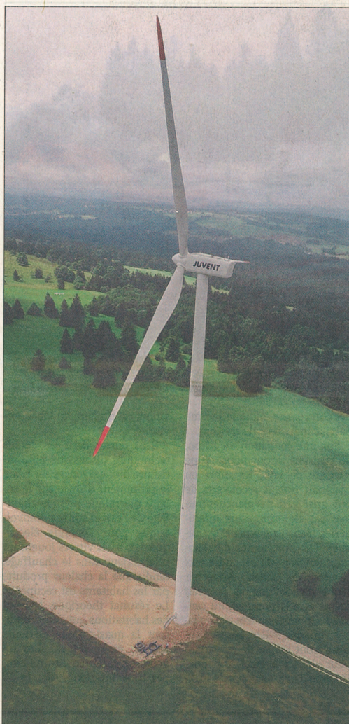
MONT-CROSIEN Le parc éolien du Jura bernois se trouve à l'est des sites de la Joux-du-Plâne, La Vue-des-Alpes et Crêt-Meuron retenus dans le concept éolien neuchâtelois 2010.