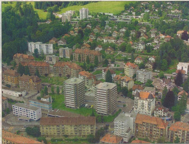
URBANISME La candidature à l'Unesco doit susciter une réflexion à long terme, et au-delà du périmètre pris en considération. Ici, vue aérienne des quartiers nord-ouest de La Chaux-de-Fonds.

Cela dit, à La Chaux-de-Fonds, le segment de l'habitat «haut standing» (location et acquisition), bien que constituant un marché de niche, répond à une demande réelle et ne doit pas être négligé. Il représente aussi l'une des conséquences de l'évolution du tissu économique et social de notre région. Plusieurs solutions intégrant des concepts architecturaux de qua-