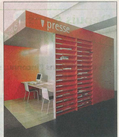
TRANSFORMATION La Bibliothèque de la Ville rénovée par Julien Dubois Architectes SA.