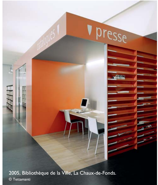
2005, Bibliothèque de la Ville, La Chaux-de-Fonds.