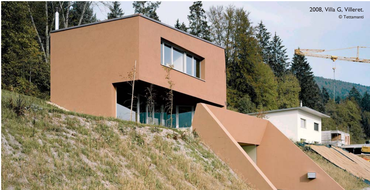
2008, Villa G, Villeret.