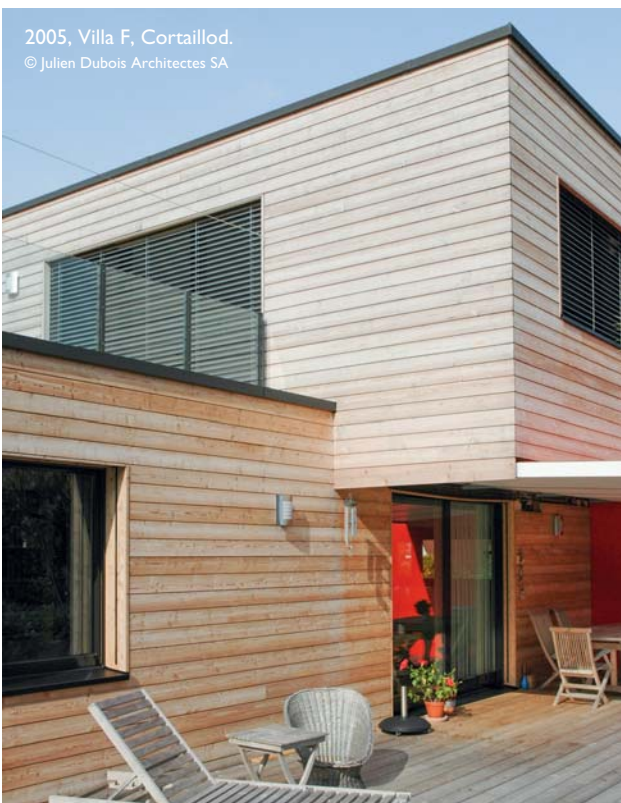
2005, Villa F, Cortaillod. © Julien Dubois Architectes SA

Au bout de deux ans, j'ai embauché ma première employée, et par la suite, quasiment chaque année, un·e nouveau·elle collaborateur·trice est venu·e agrandir l'équipe. Nous sommes aujourd'hui 17. Ma femme, architecte elle aussi, nous a rejoint il y a bientôt un an. Les projets prennent chaque fois plus d'envergure, et certains valent plusieurs dizaines de millions, voire plus.»