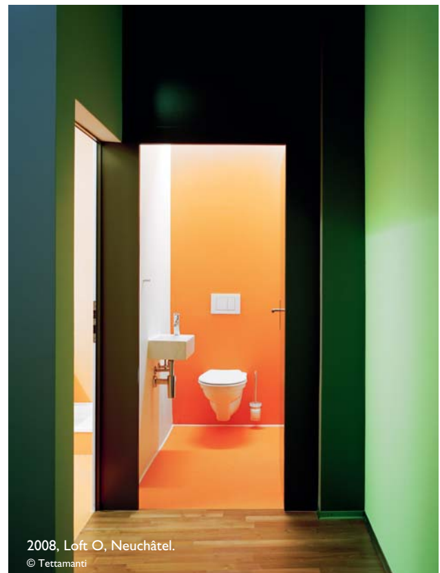
2008, Loft O, Neuchâtel. © Tettamanti

« Quand on parle de couleur, on pense forcément à L'Îlot Vert, cet immeuble mixte en plein centre ville de La Chaux-de-Fonds inséré au milieu des bâtiments du quartier. Tout en s'inscrivant dans la trame orthogonale de la ville, ici on a misé sur la transparence avec de grandes baies vitrées et des redents pour faire entrer la lumière. Inauguré en 2019, L'Îlot Vert était notre premier bâtiment de cette importance. J'aime énormément la dimension humaine de notre travail. On participe à des concours, mais il y a aussi beaucoup de rencontres, parfois même un simple appel téléphonique, qui peuvent mener à des projets. »