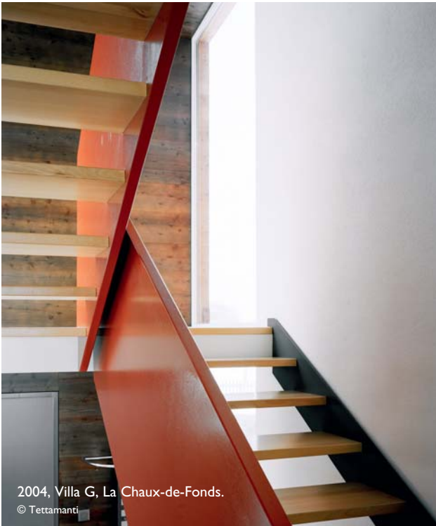
2004, Villa G, La Chaux-de-Fonds.