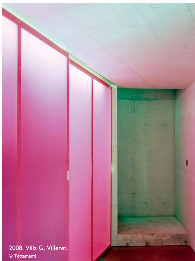
2008, Villa G, Villeret.