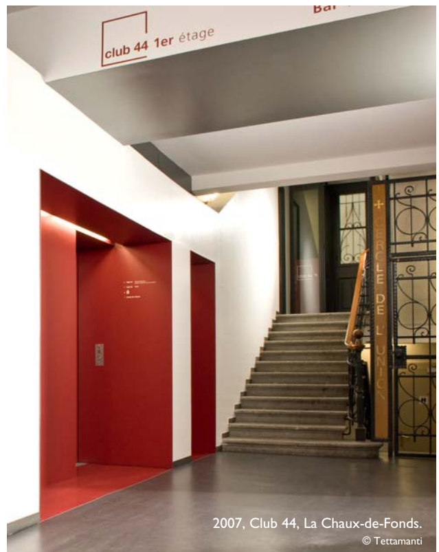
2007, Club 44, La Chaux-de-Fonds.