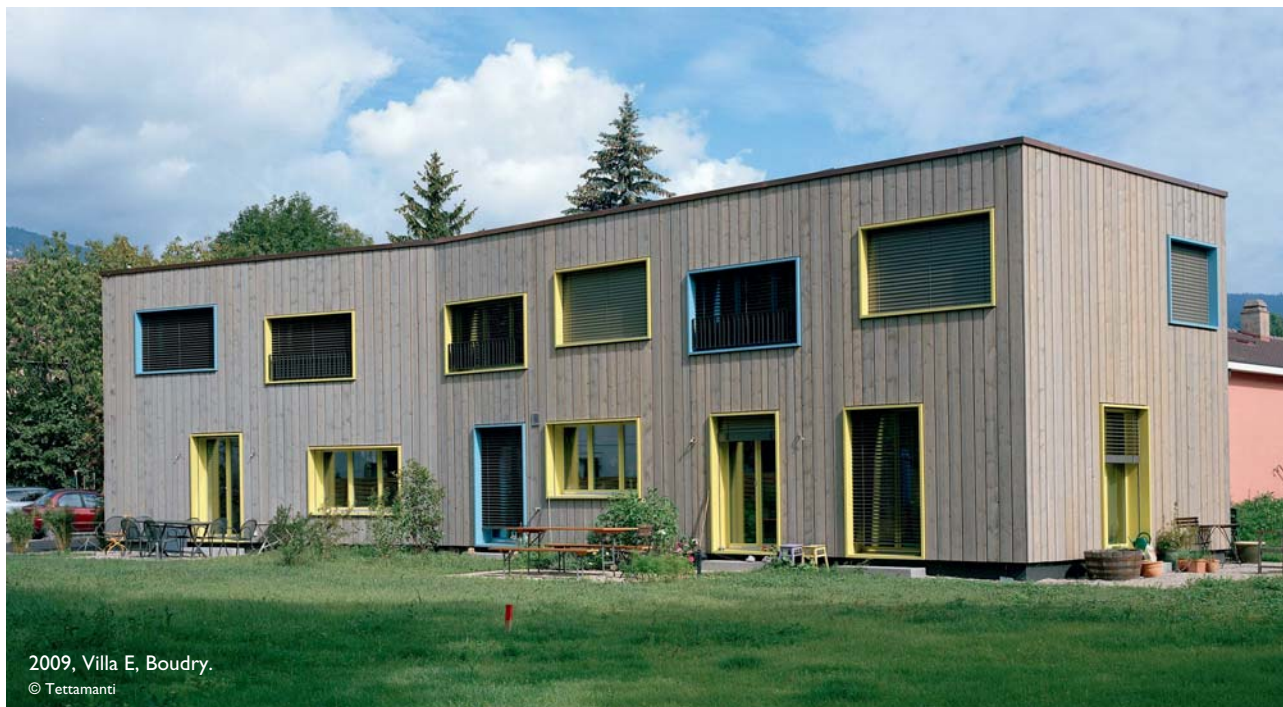
2009, Villa E, Boudry.

Ici encore, on a privilégié la couleur, qui se marie très bien avec le bois. Pendant mes études, j'ai collaboré avec un artiste peintre avec lequel j'ai appris que la couleur amène de la plus-value aux volumes. Le bureau travaille beaucoup sur ce point.»